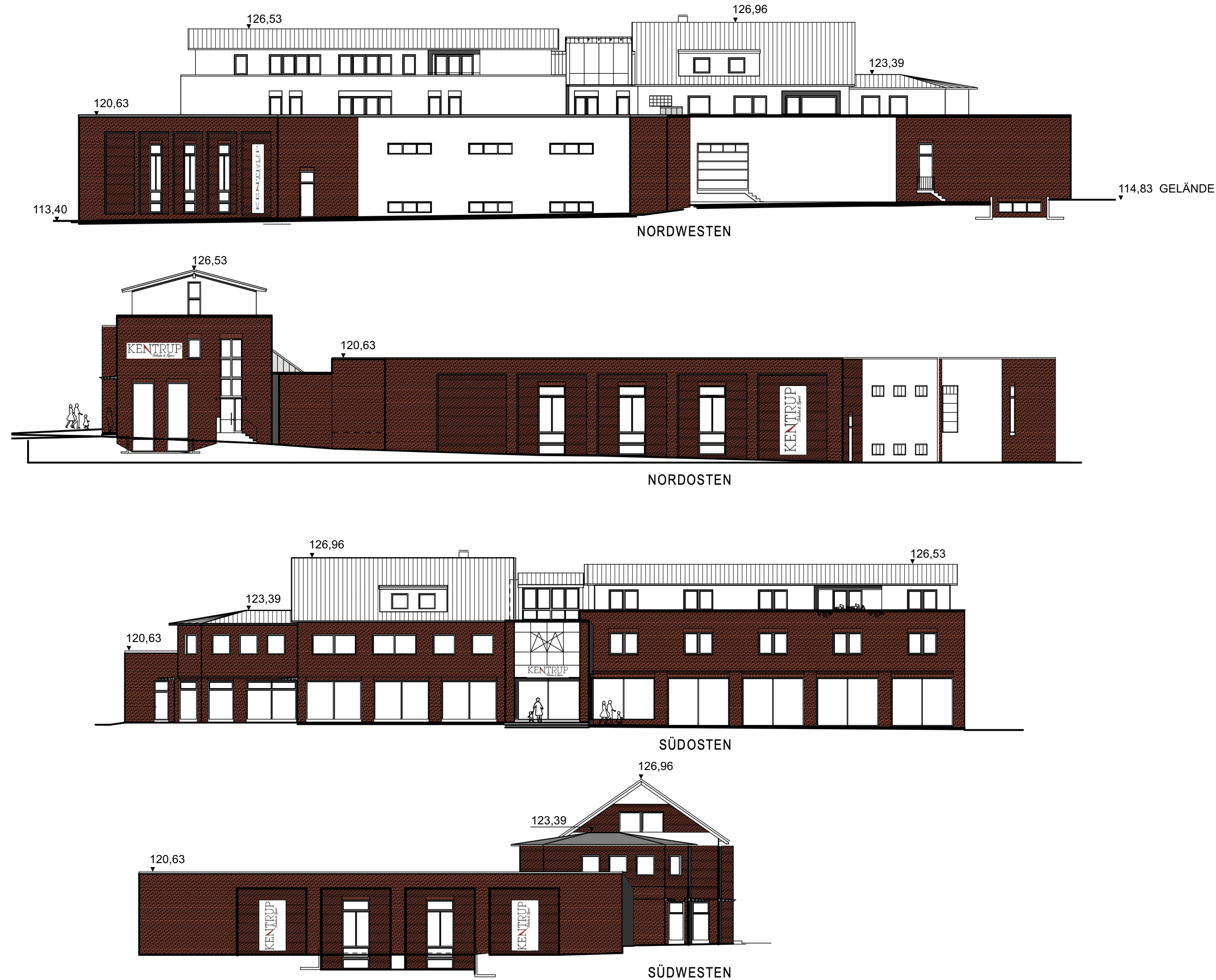
Ansichten M 1 : 250