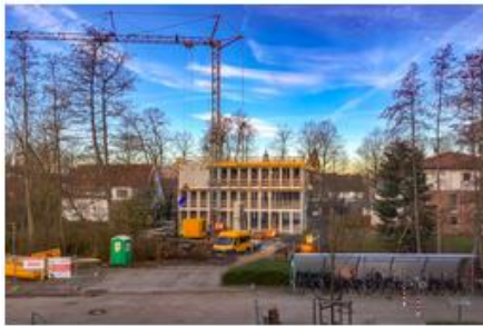
Kreishaus V im Bau

Anschließend den Themenatlas „Bauen & Wohnen“ auswählen und dann den Ordner Bauleitplanung