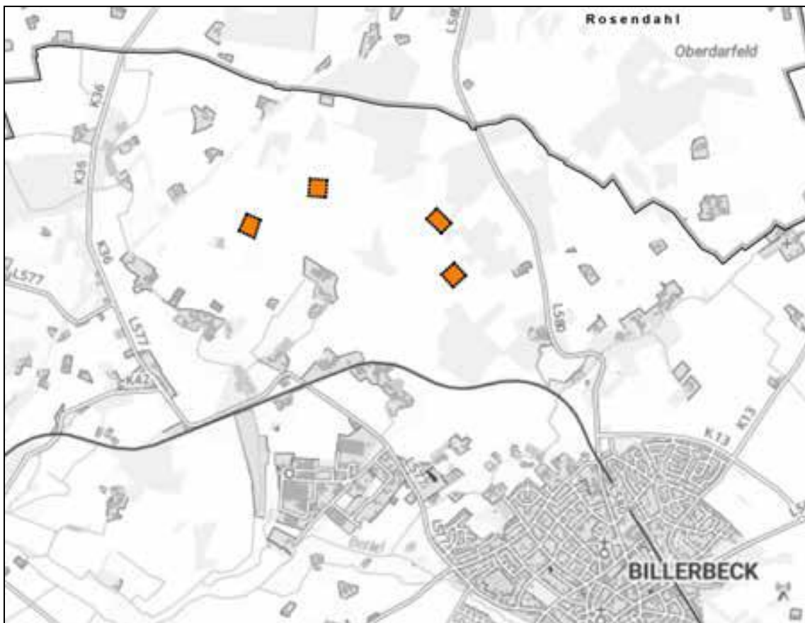
Abbildung 1: Lage der Sondergebiete im Stadtgebiet Billerbeck (unmaßstäblich).

Der räumliche Geltungsbereich ist den nachstehenden Übersichtskarten zu entnehmen: